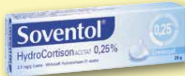
Soventol® HydroCortisonAcetat 0,25% 20 g