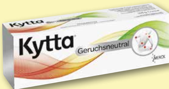
Kytta® Geruchsneutral 100 g