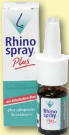
Rhinospray® Plus Nasenspray 10 ml