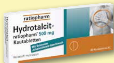
Hydrotalcit- ratiopharm® 500 mg 20 Tabletten