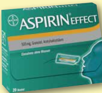
Aspirin® Effect 20 Beutel

Im Sommer freuen wir uns auf die „schönsten Tage des Jahres“. Damit diese Freude möglichst ungetrübt bleibt, sollten wir uns auch auf kleinere gesundheitliche Notfallsituationen im Urlaub vorbereiten. Dies gelingt mit einer Reiseapotheke, die optimal ausgestattet ist. Was eine Reiseapotheke beinhalten sollte, erfahren Sie in Ihrer Guten Tag Apotheke und in der aktuellen Ausgabe des Kundenmagazins „Mein Tag“. Gute Reise!