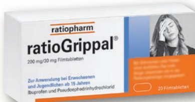
ratioGrippal® 200 mg/30 mg 20 Filmtabletten