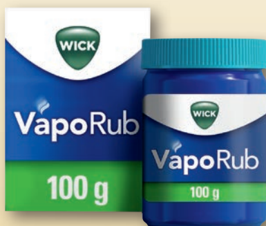
Wick VapoRub Erkältungssalbe 100 g

Achten Sie auf weitere Angebote in unserer Apotheke!