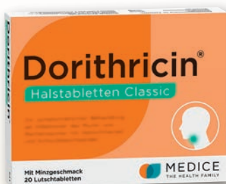
Dorithricin® Halstabletten Classic 20 Lutschtabletten

Wertvolle Anregungen haben wir im Dezember-Heft auch für Sie, sofern Sie unter kalten Füßen leiden. Und da Weihnachten nicht nur das Fest der Liebe, sondern auch des guten Essens ist, geben wir praktische Tipps, wie der Weihnachtsschmaus ein Genuss für jeden Geschmack wird. Dazu wie immer weitere spannende Hintergrundberichte sowie interessante News aus medizinischer Wissenschaft und Forschung.