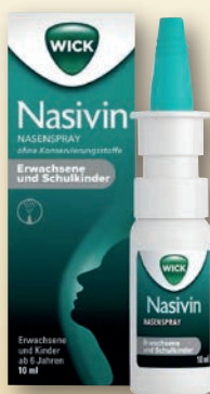
Wick Nasivin Nasenspray

für Erwachsene und Schulkinder, ohne Konservierungsstoffe 10 ml