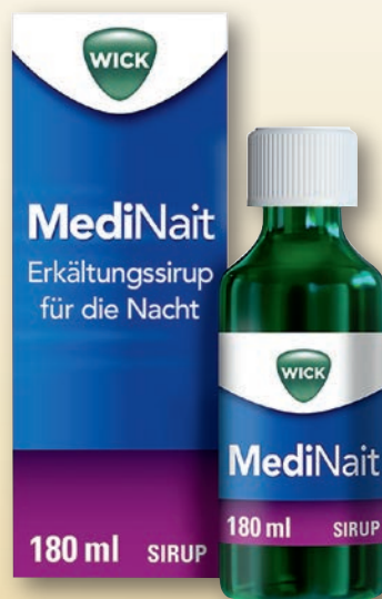
Wick MediNait Erkältungssirup für die Nacht